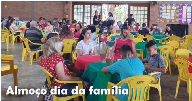
Almoço dia da família