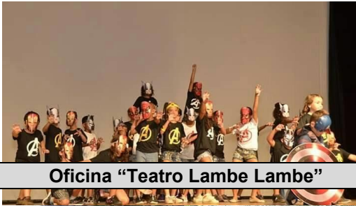
Oficina "Teatro Lambe Lambe"

Utilidade Pública Municipal - Lei nº 7.734 de 25/11/1999/ CNPJ nº 02.723.572/0001-24