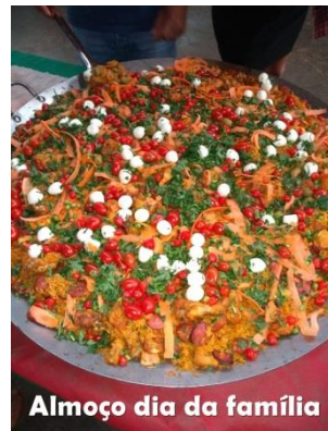
Almoço dia da família