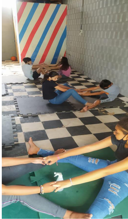
Aquecimentos depois posturas básicas e alongamentos