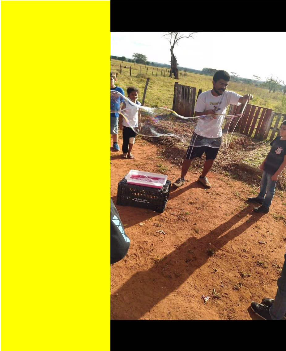
Aula lúdica com brincadeiras e confecção de bolha de sabão gigante

Também tivemos progressos no que se refere à adesão das aulas de iniciação esportiva, pois, os alunos que antes apenas olhavam a aula acontecer, agora participam, seja ajudando a organizar a aula, ou participando das atividades em quadra.