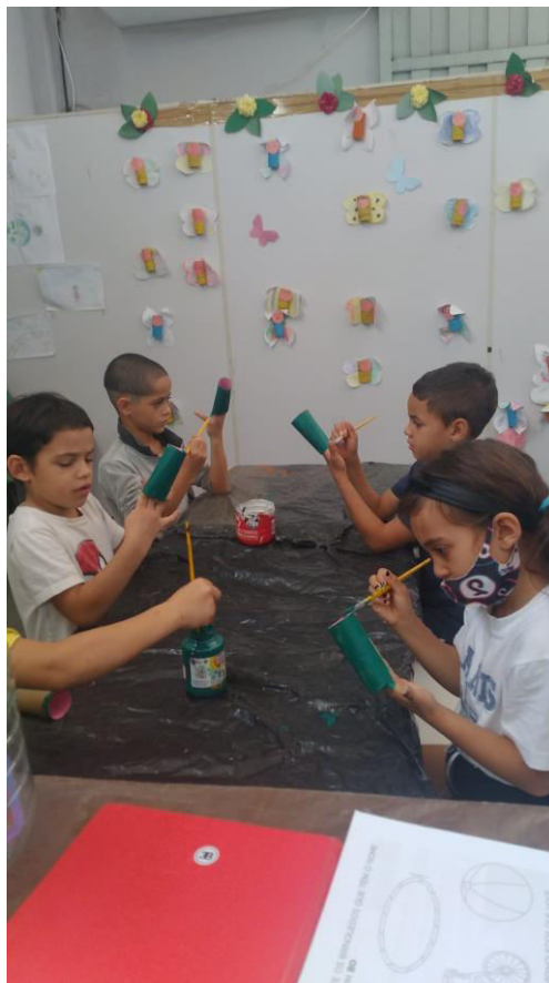
PINTURA DE ROLINHO