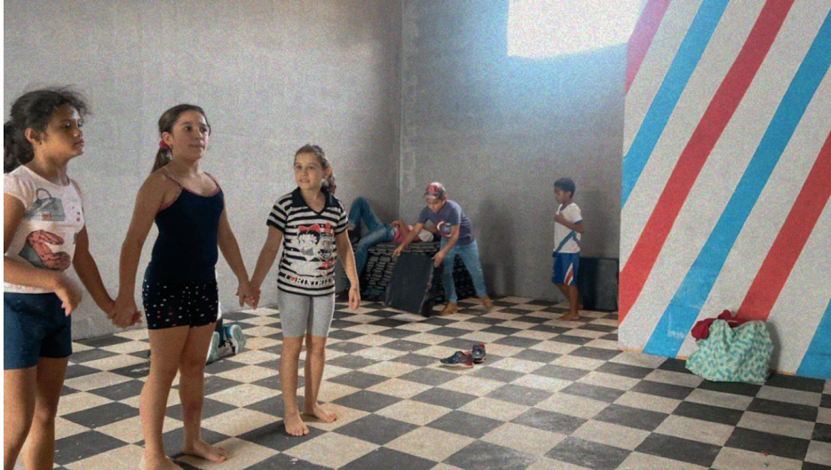
PROCESSO DE MONTAGEM DE COREOGRAFIA COM OS ALUNOS