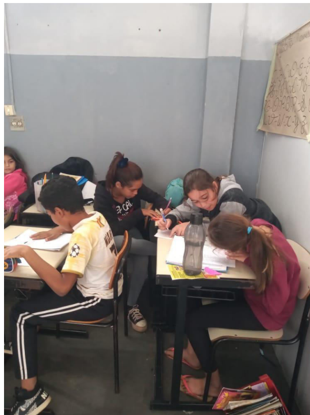
Auxílio a tarefa