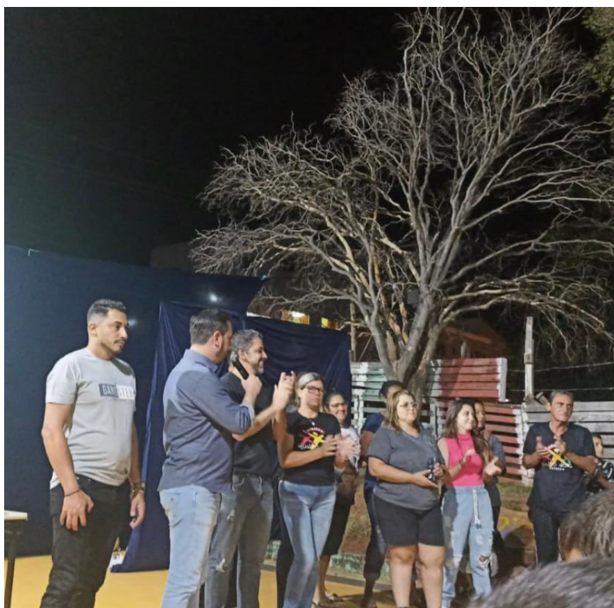
REUNIÃO DE PAIS COM O FUNDADOR DO PROJETO MUNDO NOVO