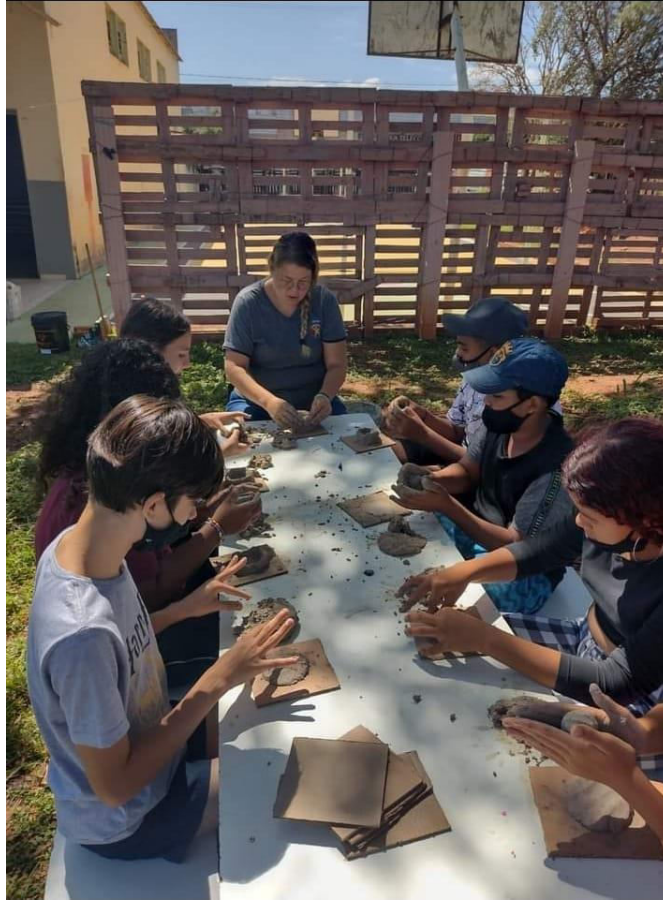
CONFEÇÃO VASOS DE ARGILA