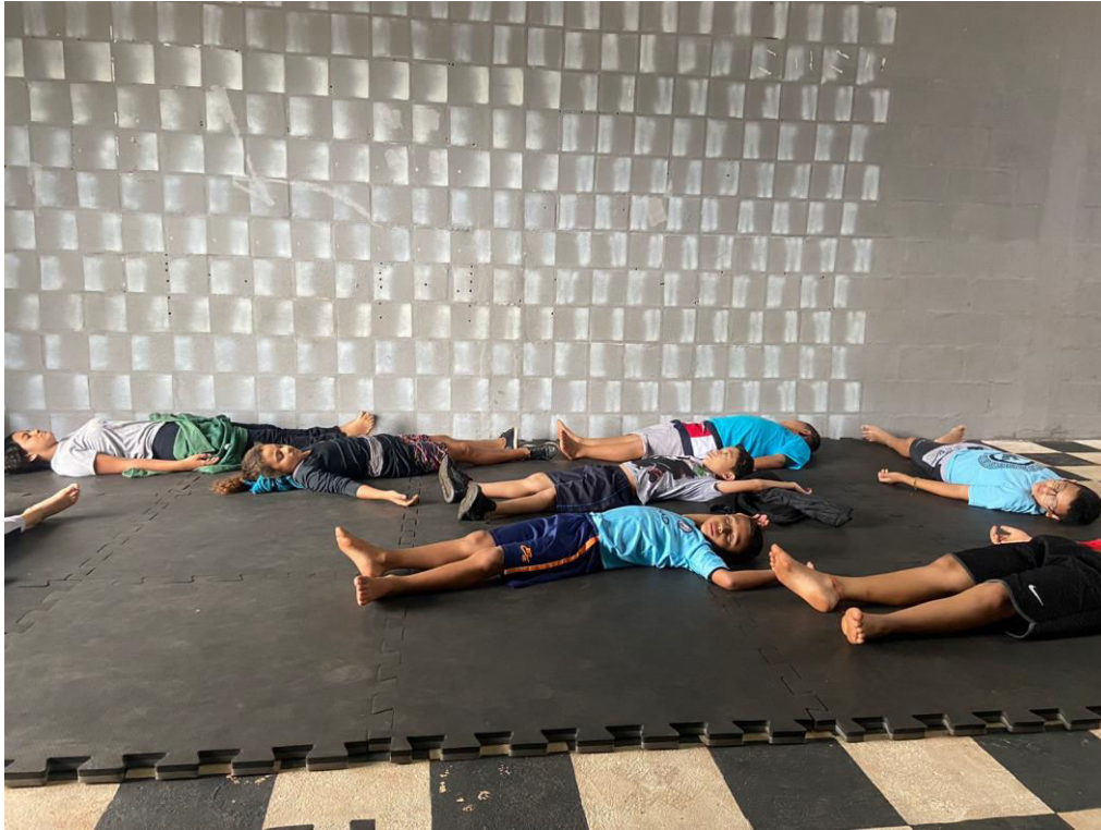
FINALIZAÇÃO DAS AULAS – HORA DO RELAXAMENTO