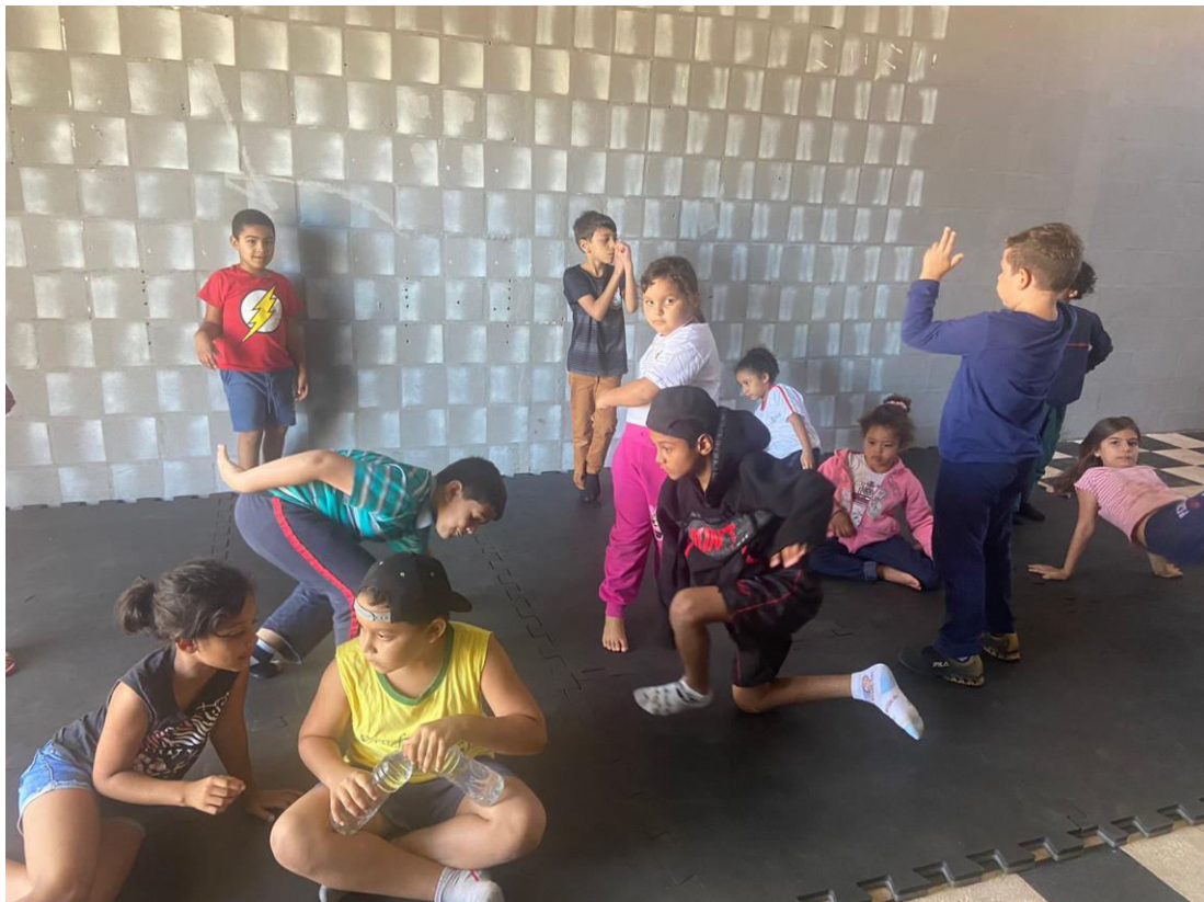
BRINCADEIRA "ESTÁTUA" COM A TURMA 1 – TARDE