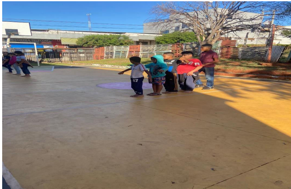
PROCESSO DE MONTAGEM DE COREOGRAFIA COM OS ALUNOS