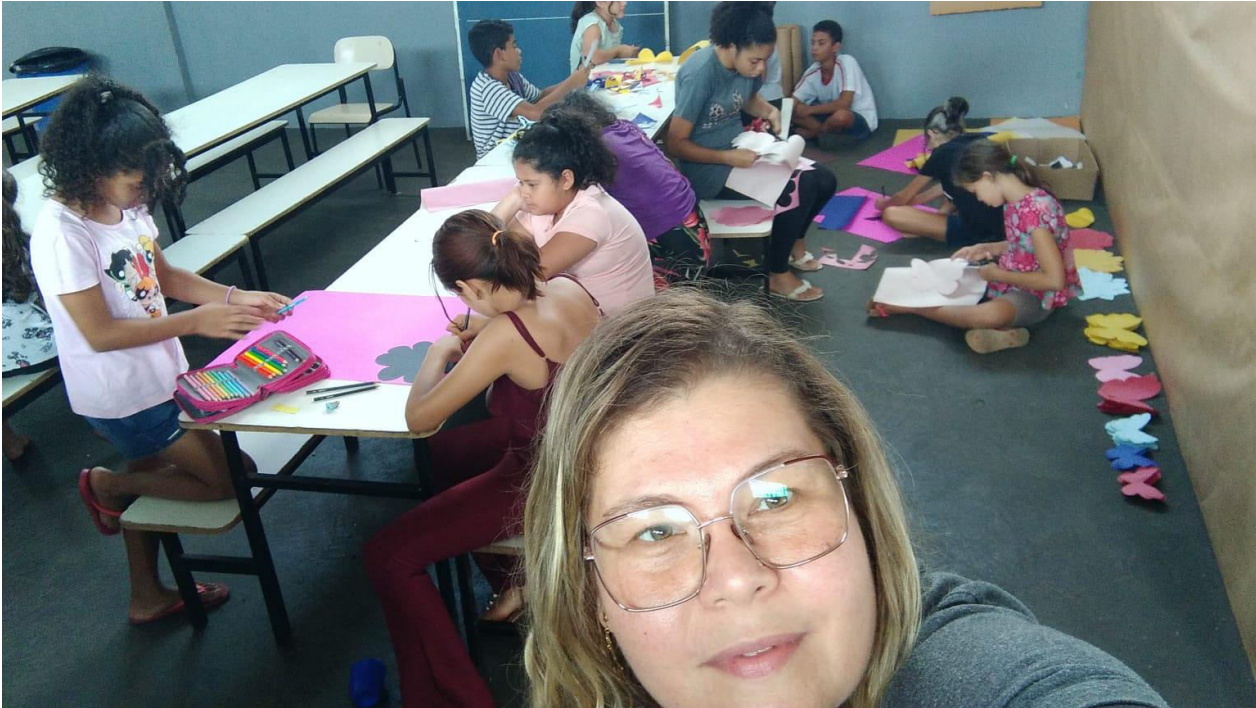
PAINEL DIA DAS MÃES