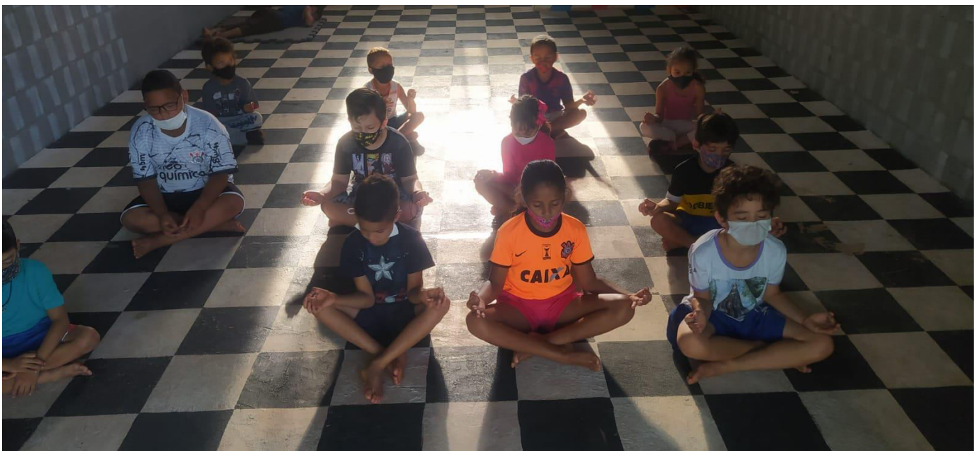
Aquecimento com posturas e desenvolvimento motor