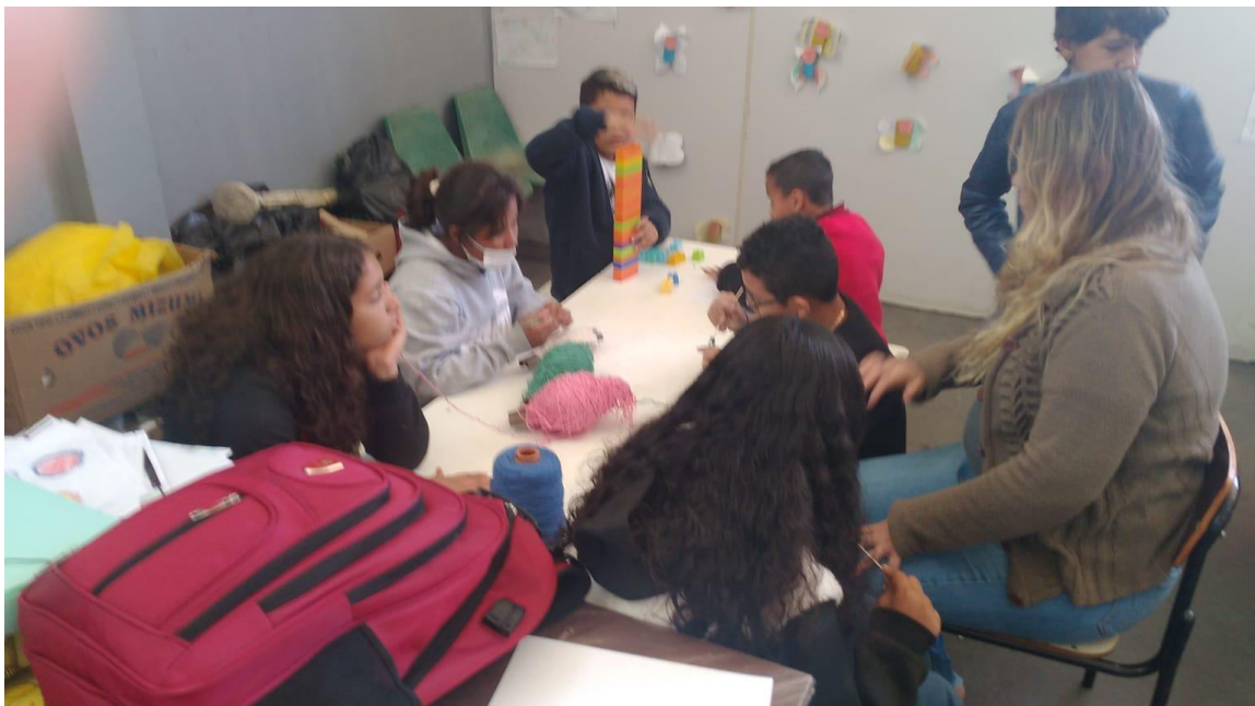
TAPETES DE CROCHE