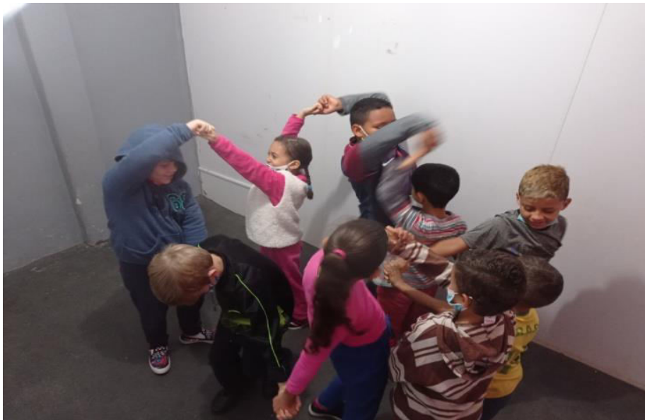
Exercícios de Improvisos Teatrais

A aula de Teatro oferece vários recursos que podem ser utilizados para a alfabetização utilizando-se da visão dos Exercícios; Montagem de histórias e cenas; Ensaios; Dinâmicas; Jogos Teatrais e Apresentações, carregando em si significados e significantes abrangentes. Com turmas que respondem bem a proposta de trabalho desenvolvida e melhoram seu desempenho frente aos exercícios e desafios apresentados, evoluindo segundo a capacidade de cada um.