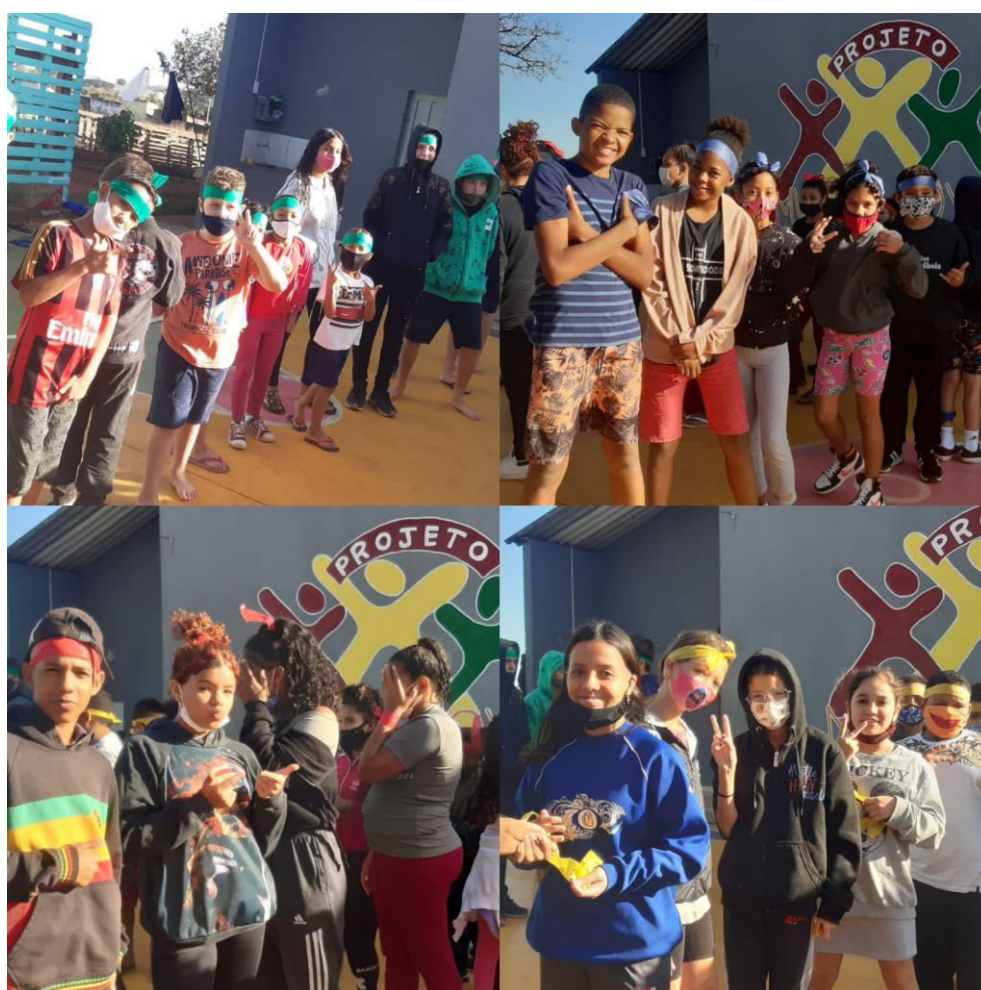
COLONIA DE FÉRIAS JULHO 2022 – 1º DIA DE GINCANA – PERÍODO INTEGRAL