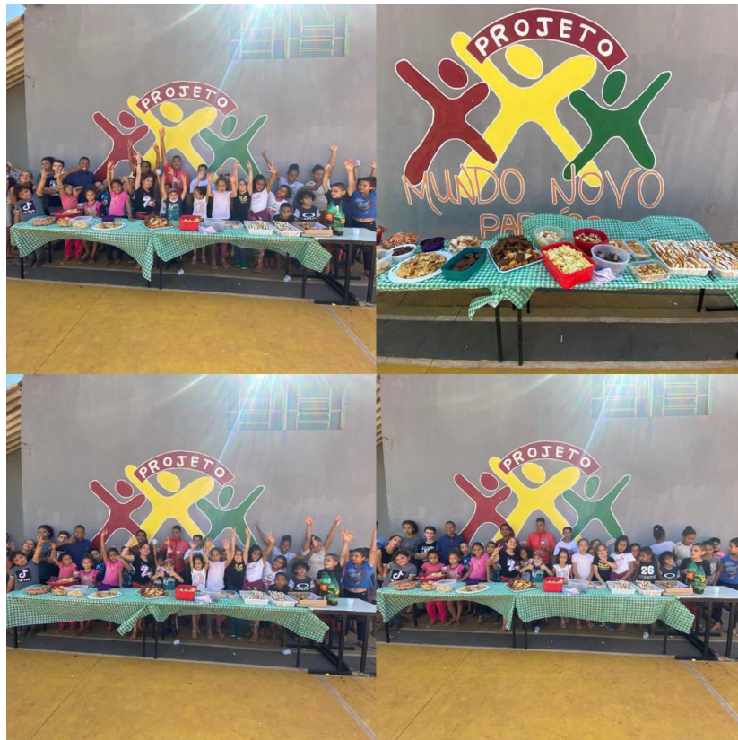
COLONIA DE FÉRIAS JULHO 2022 – CAMINHADA RURAL E PIQUENIQUE – PERÍODO INTEGRAL