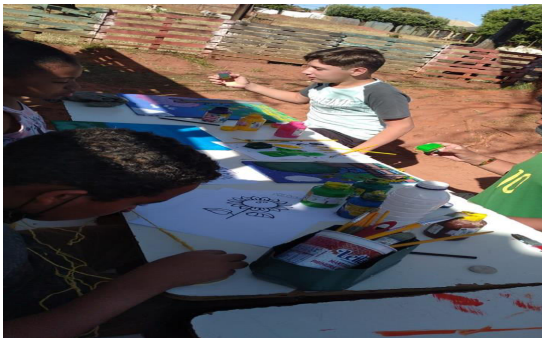
Pintura de fundo de tela, piso

Com o estudo do artesanato as crianças desenvolveram habilidades de acordo com sua faixa etária a coordenação motora fina, as habilidades cognitivas, sua criatividade e a valorização pessoal.