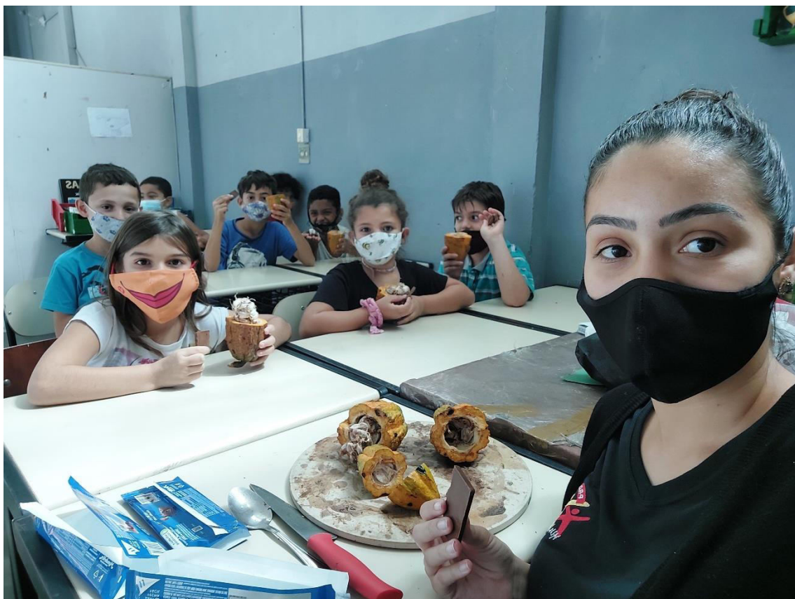
DIA DO CHOCOLATE