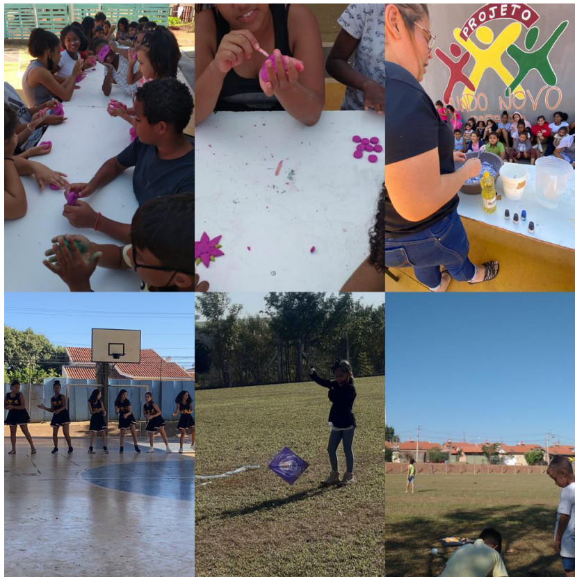
COLONIA DE FÉRIAS JULHO 2022 – DIA DE SOLTAR PIPAS E APRESENTAÇÃO DE TEATRO E DANÇA NO PROJETO VIVA ELDORADO – PERÍODO INTEGRAL