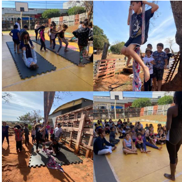
COLONIA DE FÉRIAS JULHO 2022 – AULÃO DE CIRCO – PERÍODO INTEGRAL