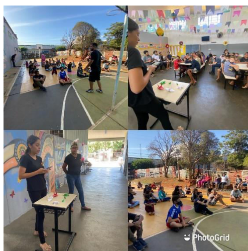
COLONIA DE FÉRIAS JULHO 2022 – DIA DE ORIGAMI E AULÃO DE KUNG FU – PERÍODO INTEGRAL