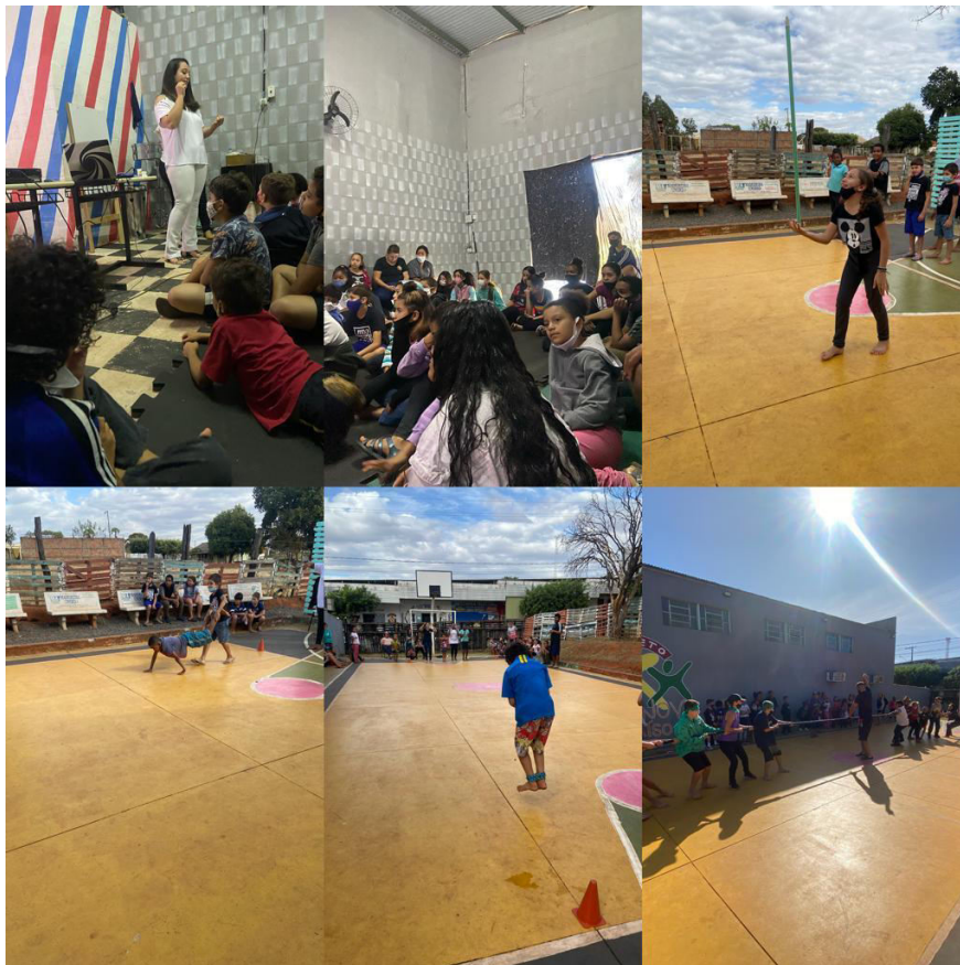
COLONIA DE FÉRIAS JULHO 2022 – PALESTRA DE HIGIENE BUCAL E 2º DIA DE GINCANA – PERÍODO INTEGRAL