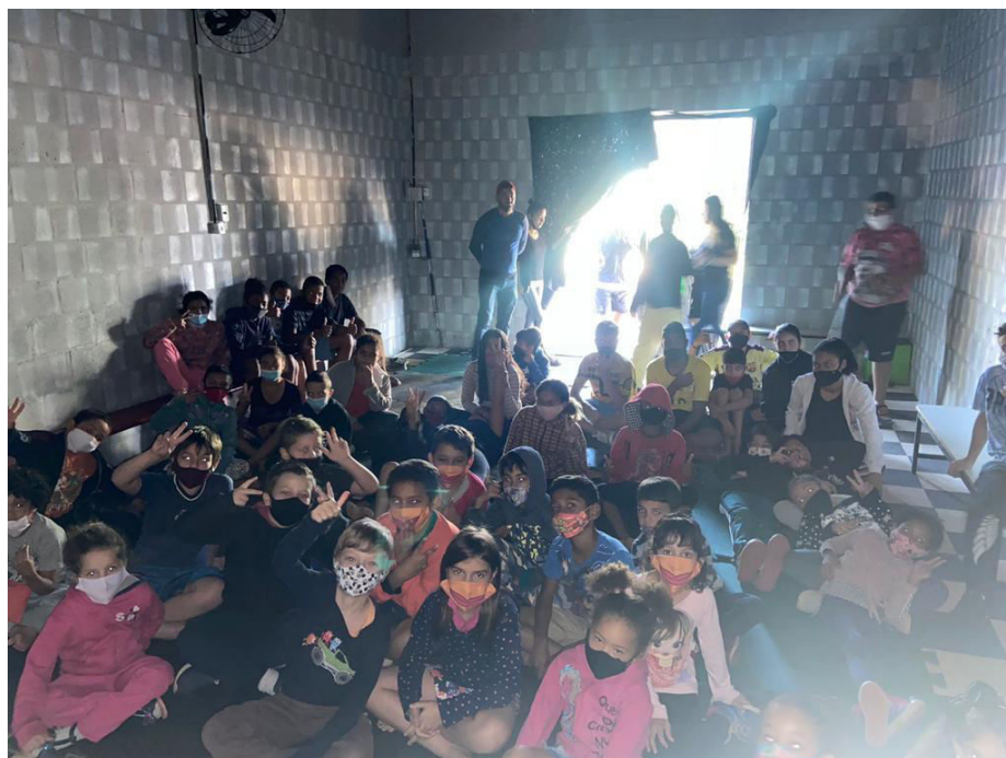
COLONIA DE FÉRIAS JULHO 2022 – DIA DE CINE E PIPOCA – PERÍODO INTEGRAL