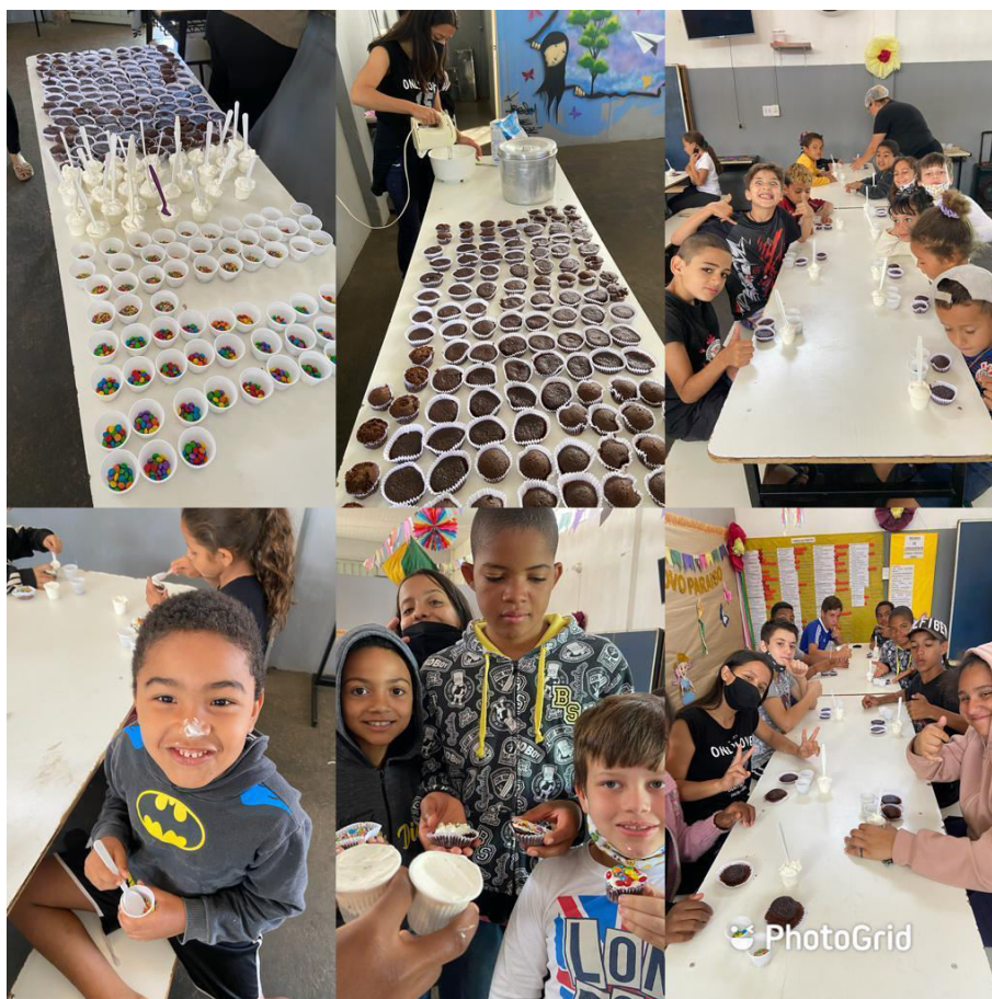
COLONIA DE FÉRIAS JULHO 2022 – DIA DE PRODUÇÃO DE CUPCAKE – PERÍODO INTEGRAL