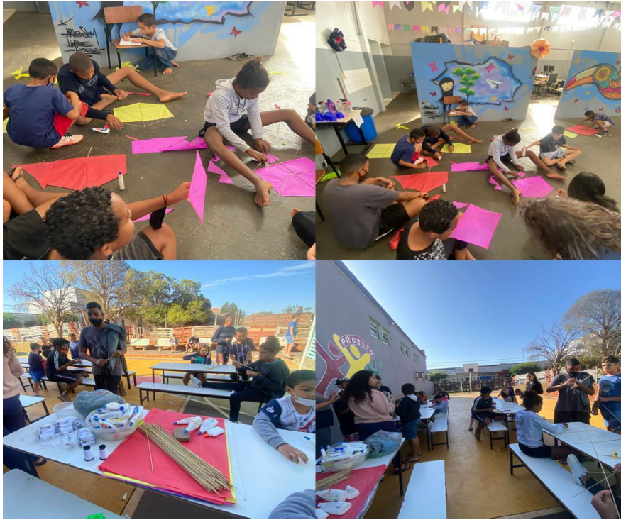
COLONIA DE FÉRIAS JULHO 2022 – DIA DE PRODUÇÃO DE PIPAS – PERÍODO INTEGRAL