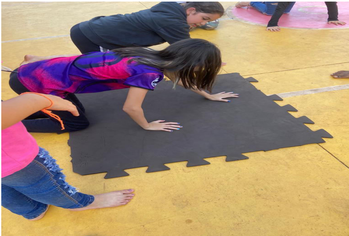
ATIVIDADE DE MOBILIDADE – TURMA 2 TARDE