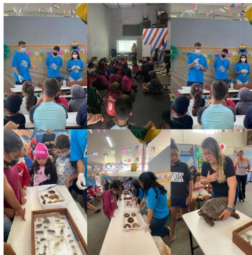
COLONIA DE FÉRIAS JULHO 2022 – PALESTRA COM BIOLOGOS DA UNESP – PERÍODO INTEGRAL