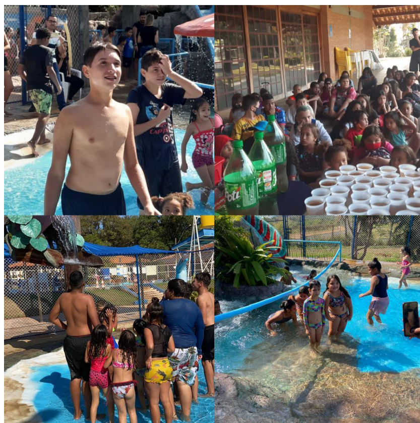
COLONIA DE FÉRIAS JULHO 2022 – DIA DE PASSEIO INTEGRAÇÃO ENTRE OS NUCLEOS PROJETO MUNDO NOVO PARAISO JOÃO PAULO PIC – PERÍODO INTEGRAL