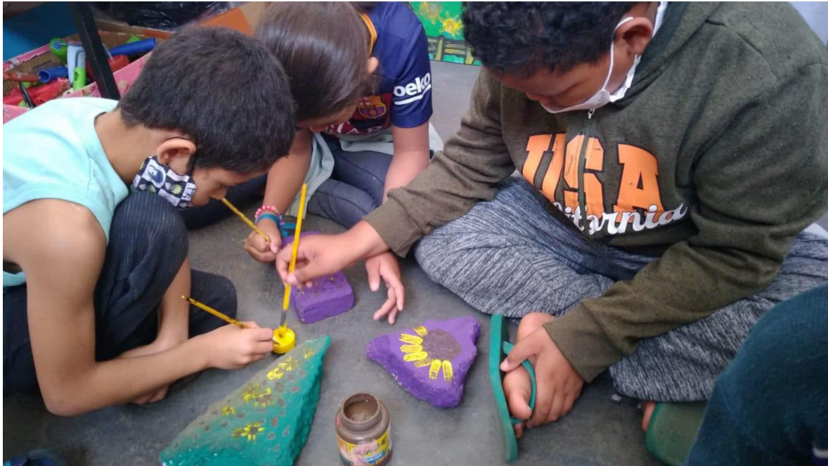
Pintura de GIRASSOL