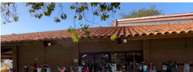
ado I CE Rio Pret